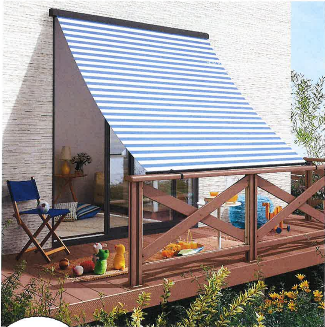
枠付 手すり固定タイプ 18628 マリンボーダー